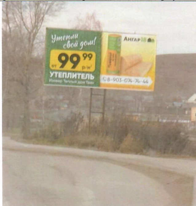
Фото рекламной конструкции

«8» ноября 2024 года отделом архитектуры и градостроительства Администрации муниципального образования «Майминский район» выявлена рекламная конструкция, установленная и (или) эксплуатируемая без разрешения, срок действия которого не истек, установленного по адресу (в случае отсутствия технической возможности определить точное местоположение, указывается ориентировочное расположение): в границах земельного участка с кадастровым номером 04:01:010409:1057, ориентир 2км.+335м. дорога 84К-14 «Горно-Алтайск-Карлушка» (слева).